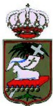
Concellaría de Poio